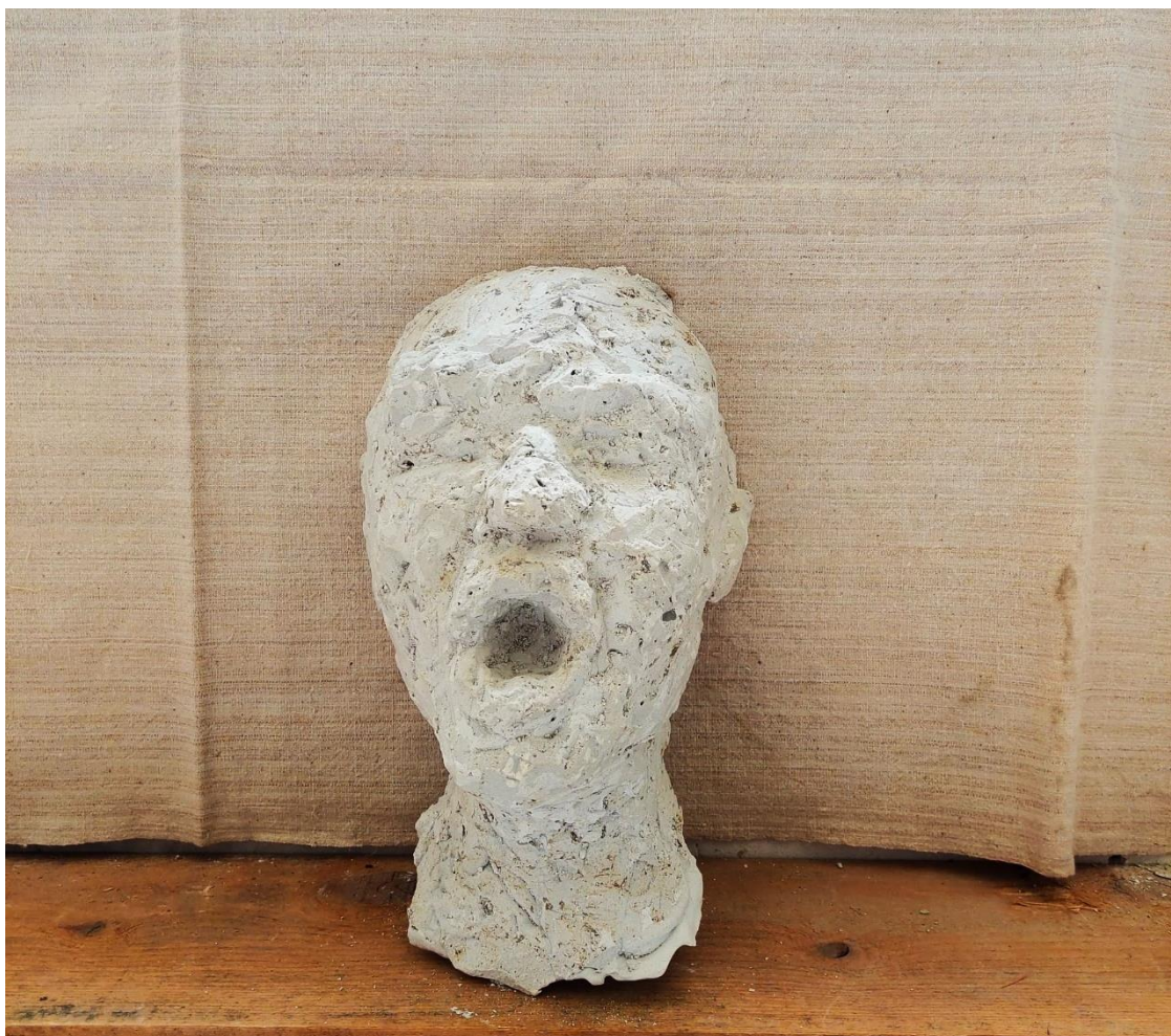
Detalj rada Maske, 2023., gips