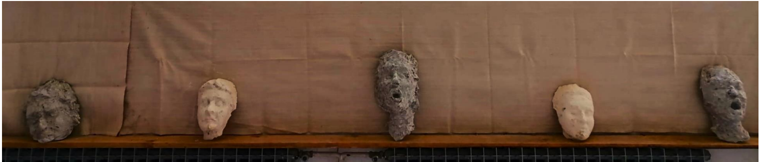
Maske, 2023., gips

Grubi ali i nježno modelirani detalji, nagli i lagani prijelazi iz plohe u plohu; svaki taj detalj dočarava naše karakteristike koje smo imale priliku prepoznati i upoznati u našem dugotrajnom prijateljstvu i koje smo odlučile prikazati u ovome radu. Naše maske smo postavili kao friz u kojem se naizmjenično nižu moji prikazi Marije i njeni prikazi mene, kako bi na taj način još više naglasile našu uzajamnu interakciju i dinamičan odnos.