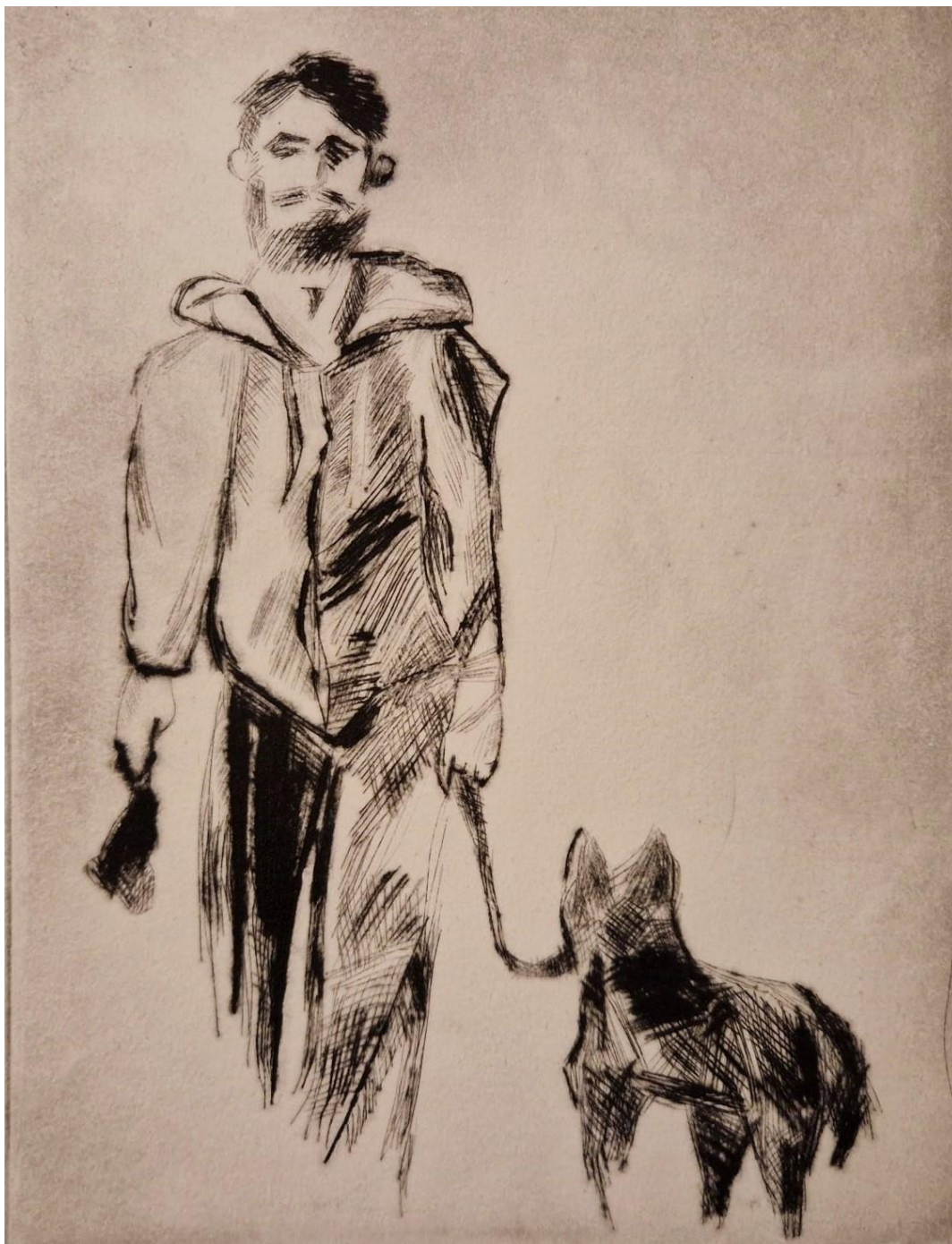
Šetnja, 2023., suha igla, 15 x 20 cm

Suha igla/bakropis, tehnika koju sam koristila prilikom izrade ovoga rada pružila mi je tu slobodu i prikaz dinamičnosti mojih pokreta te ona rezultira isplaniranim potezima, no i već spomenutim iznenadnim prelijevanjima tinte po otisku, u čemu je i čar grafike; koliko planiranih poteza i pokreta mogu krenuti u potpuno drugome smjeru.