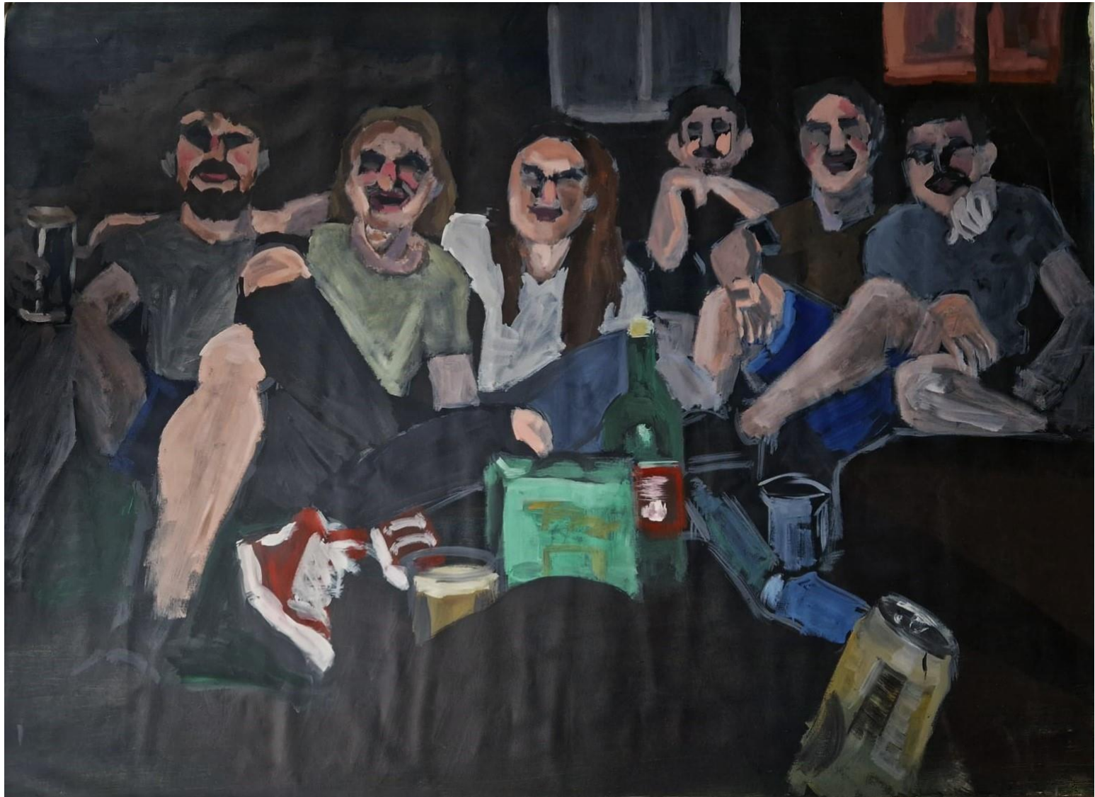
Na Savi , 2023., akril na platnu, 120 x 165 cm

Iako nedefinirana lica, kroz njih se mogu osjetiti emocije likova i osjećaj slobode koji dijele jedni s drugima na toploj, ljetnoj travi doma Stjepana Radića na Savi.